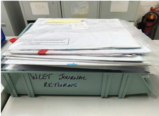
Figure 1. Retours du WCET® Journal

WCET®. Comme dans les sondages précédents 1-4 , les répondants continuaient de classer l'ETNEP/REP (74,13 %), le WCET® Journal (73,68 %), le Congrès (67,57 %) et le site Web (63,95 %) comme les quatre atouts les plus appréciés du WCET®. Cette année, pour la première fois, l'ETNEP/REP a été classé en tête avant le WCET® Journal dans la réponse à ce que les membres considéraient le plus important.