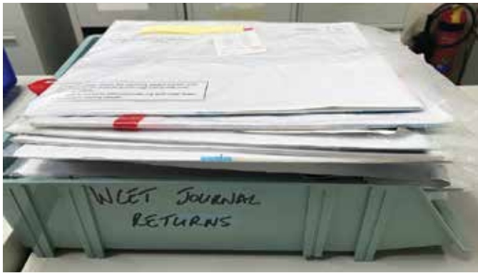
Figura 1. Devoluções da Revista do WCET®

nas pesquisas anteriores 1-4 , os respondentes continuam a classificar o ETNEP/REP (74,13%), a Revista do WCET® (73,68%), o Congresso (67,57%) e o site (63,95%) como os quatro recursos mais valiosos do WCET®. Este ano, pela primeira vez o ETNEP/REP foi classificado acima da Revista do WCET® na resposta do que é mais importante para os associados.