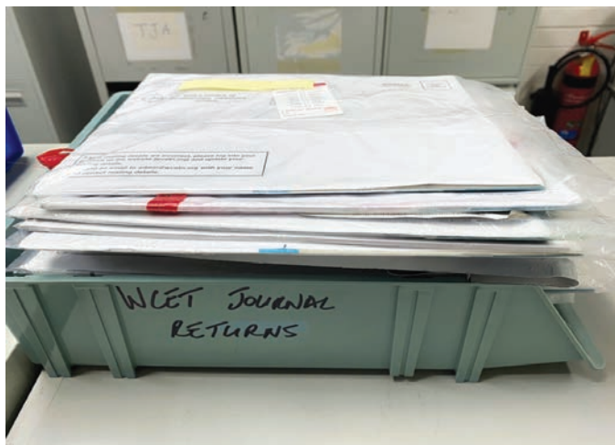
Figura 1. Devoluciones de la WCET® Journal

como los cuatro recursos del WCET® más valiosos. Este año por primera vez el ETNEP/REP fue clasificado primero por sobre la WCET® Journal para la respuesta con respecto a qué es lo más importante para los miembros.