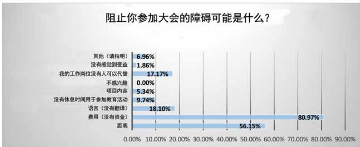
图2.参加WCET®大会的主要障碍

研讨会对会员开放，有些则是免费的。发布网址： https://wocet.memberclicks.net/wcet-webinars-other-educational-resources ，该网站上还列出了更多的教育资源。有些网络研讨会以LOTE语言提供。更多的内容将陆续推出，敬请关注！