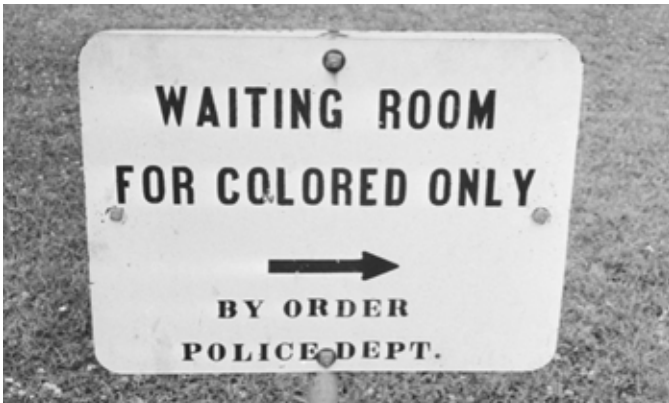
Un cartel de Akron

Akron, al mismo tiempo bastión del Ku Klux Klan, era un reflejo de los prejuicios raciales profundamente arraigados de la época. 16,17