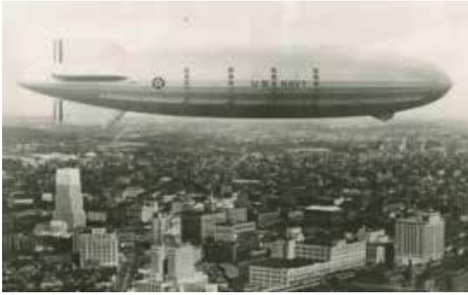
El USS Akron sobrevolando su ciudad homónima, hacia 1931-1933