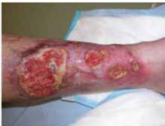
Imagen del pioderma gangrenoso para dar una idea del increíble estado en que se encontraría Gill

A su llegada, el equipo médico se encontró con un espectáculo