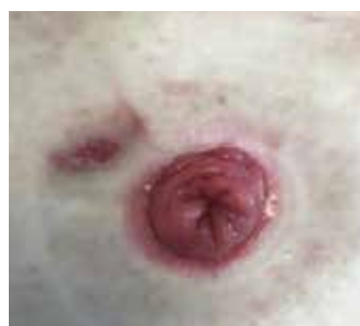
Figure 3. Étude de cas 1 - 2 septembre