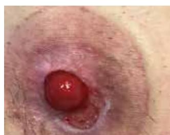
Figure 10. Étude de cas 2 - 15 octobre