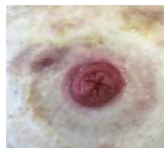
Figure 4. Étude de cas 1 - 16 septembre (fin du traitement)