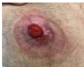
Figure 8. Étude de cas 2 - 6 août