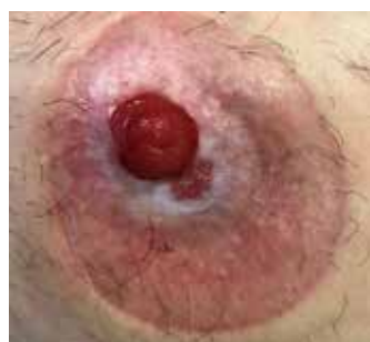
Figure 11. Étude de cas 2 - 29 octobre