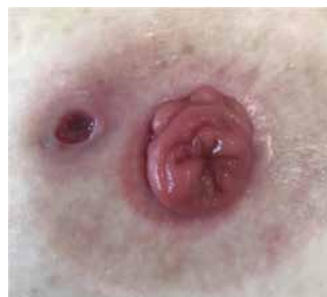
Figure 1. Étude de cas 1 - 22 juillet

Le coût du traitement standard par rapport au traitement combiné AH+SDA a montré des différences significatives (Figure 6). Le traitement combiné AH+SDA était plus de 40 % moins cher par