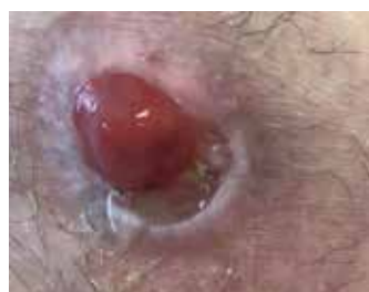
Figure 9. Étude de cas 2 - 8 octobre