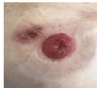
Figure 2. Étude de cas 1 - 19 août