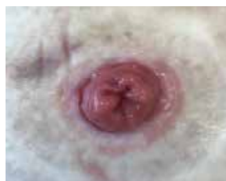
Figure 5. Étude de cas 1 - 1er octobre

changement de pansement, avec seulement 25 % du tube utilisé au total.