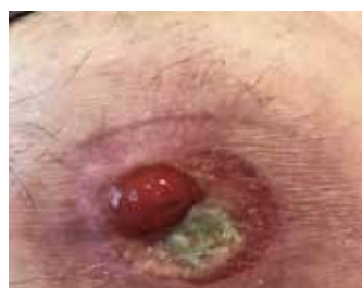
Figure 7. Étude de cas 2 - 16 juin

s'étant à nouveau détérioré (Figure 9). La plaie mesurait 10 mm x 5 mm, avec une base pâle et visqueuse, une macération des bords de la plaie, un faible exsudat et aucune douleur, ni œdème ni odeur. À ce stade, le patient est revenu au régime de traitement initial, à savoir une pommade aux corticostéroïdes toutes les deux semaines, un pansement barrière antibactérien à l'argent et un joint de stomie